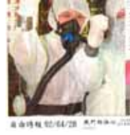
高安時攝 2004/2/28 澳門醫學中心 SARS 病房